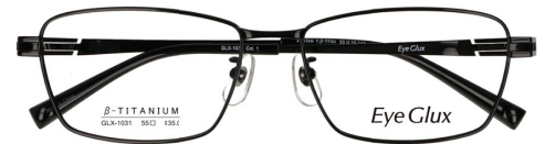
C-1 BLACK (SILVER)