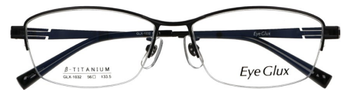
C-1 BLACK MATT (GREY MATT)