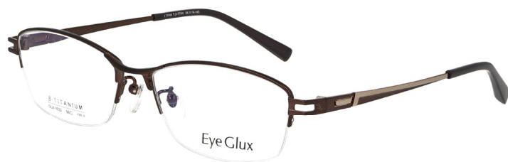
C-4 WHITE PEARL