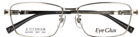
C-2 SILVER SHIRRING