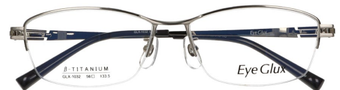
C-2 SILVER SHIRRING