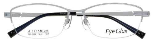
C-3 BROWN SHIRRING (GOLD SHIRRING)