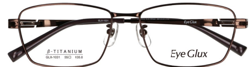
C-3 BROWN (LIGHT BROWN)