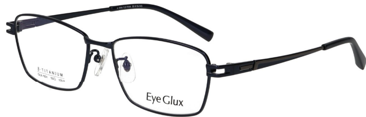
C-4 NAVY (GUNMETAL)