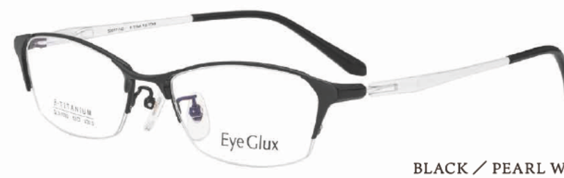
C-3 BLACK / PEARL WHITE