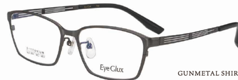
C-2 GUNMETAL SHIRRING