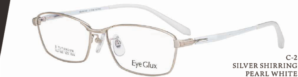
C-2 SILVER SHIRRING PEARL WHITE