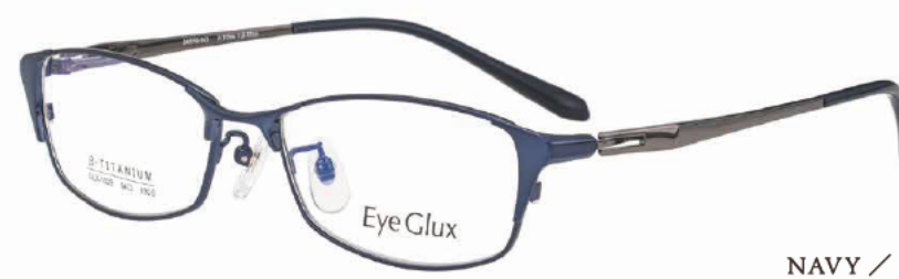
C-4 NAVY / GREY