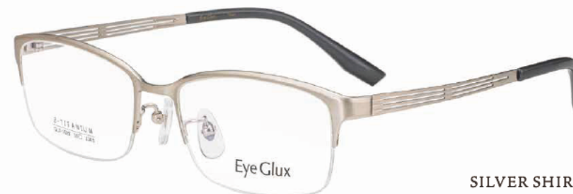
C-2 SILVER SHIRRING