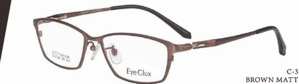
C-3 BROWN MATT