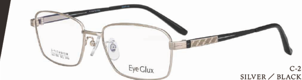
C-2 SILVER / BLACK