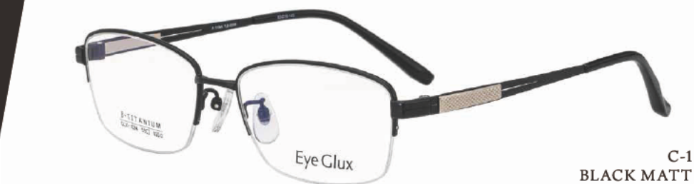
C-1 BLACK MATT