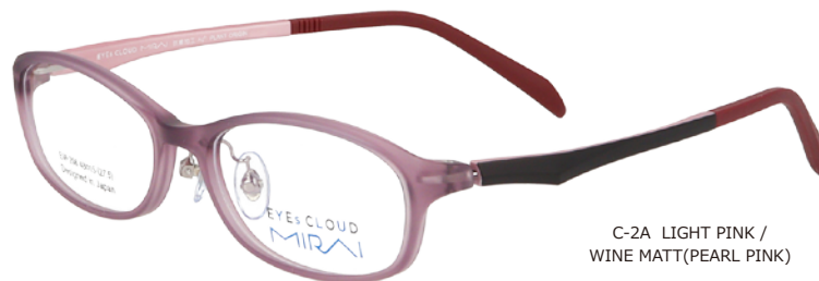
C-2A LIGHT PINK / WINE MATT(PEARL PINK)