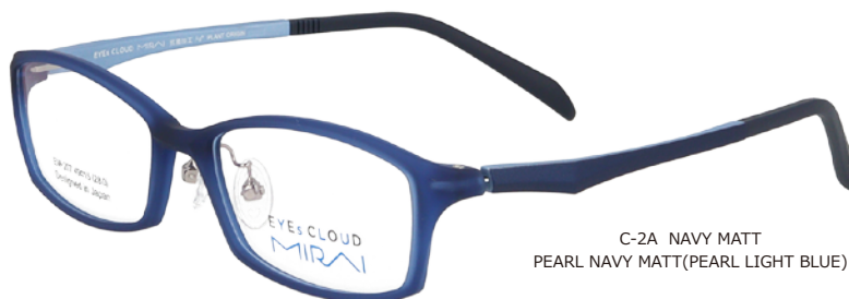
C-2A NAVY MATT PEARL NAVY MATT(PEARL LIGHT BLUE)