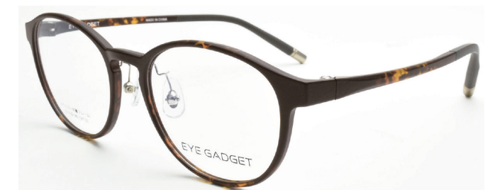
COL.3 BROWN DEMI MATT

サイズ：51□18-140 天地：41.0mm 材質：TR-90 参考上代価格：9,000円（税別）