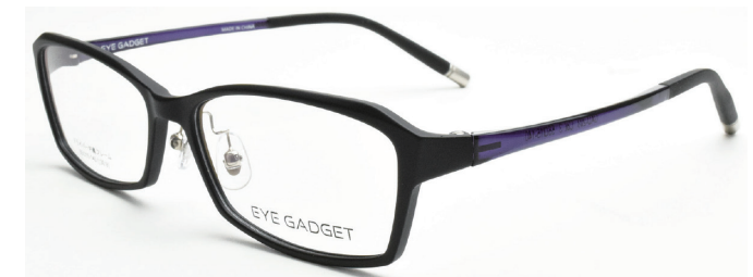
COL.3 BLACK MATT / PURPLE

サイズ：55□15-140 天地：30.9mm 材質：TR-90 参考上代価格：9,000円（税別）