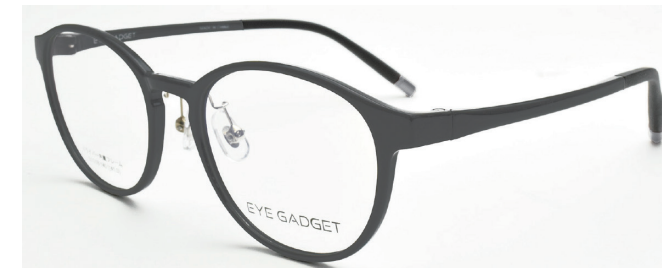
COL.2 GREY MATT