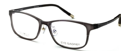
COL.3 GREY MATT

サイズ:53□17-140 天地:36.0mm 材質:弾性樹脂(TR90) 参考上代価格:9,000円(税別)