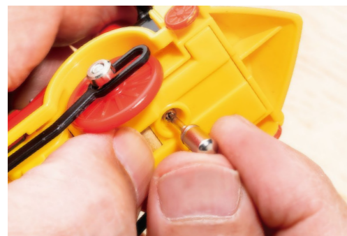
玩具やリモコンの電池交換