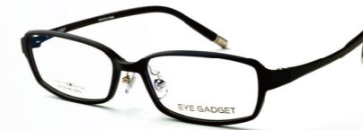
COL.1 BLACK MATT